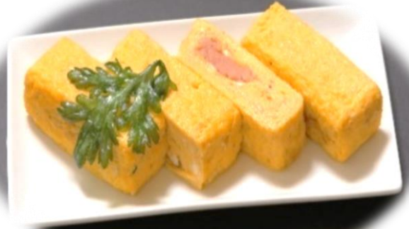
◆明太チーズ玉子焼き 680 円(税込 748 円)