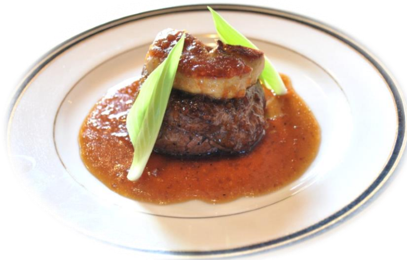
◆牛フイルステーキ 150 g とフォアグラ 3,800 円(税込 4,180 円)