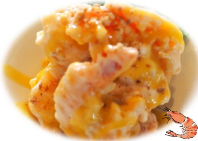
◆名物大海老マヨ 880 円(税込 968 円)