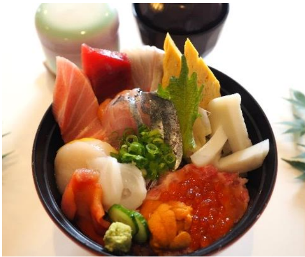
特上海鮮丼・うに、いくら付き