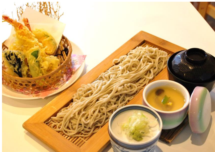
天ぷら布のりそば 1,380 円 (税込 1,518 円)