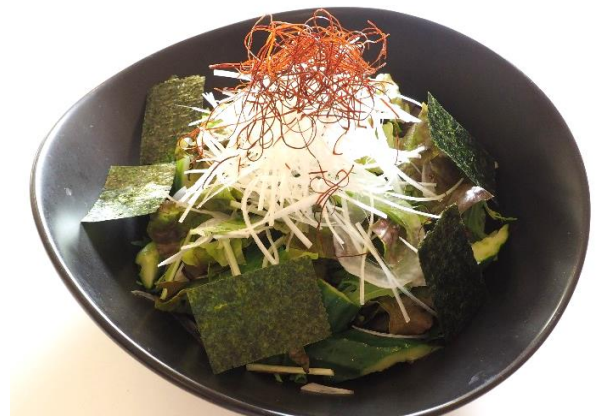
チョコレギサラダ 780 円(税込 858 円)