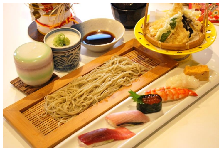
新春セット 2,000 円 (税込 2,200 円)