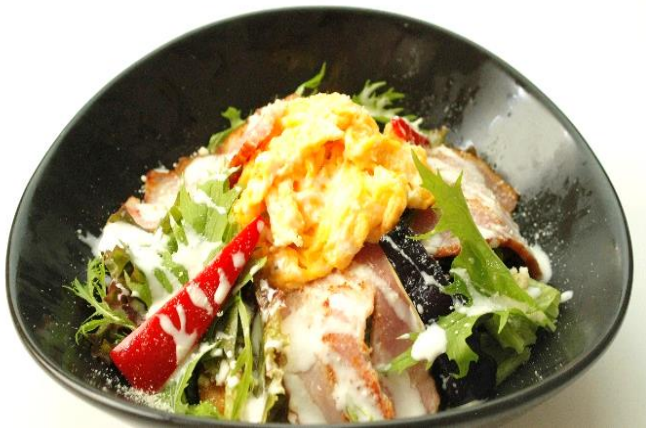
玉子で食べるあったかサラダ 1,000 円(税込 1,100 円)