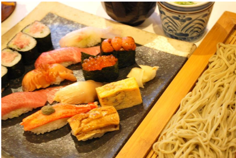
特上握り 3,200 円 (税込 3,520 円) セット布のりそば+300 円(税込 330 円)