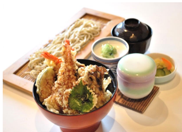
海老天井と布のりそばセット 1,800 円 (税込 1,980 円) 単品海老天井 1,400 円 (税込 1,540 円)