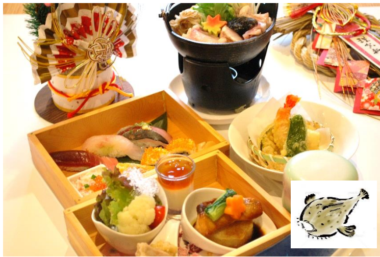
あんこう鍋付き 白木二段弁当 2,800 円 (税込 3,080 円) あんこう鍋・カフラワーとペンネサラダ・チーズ豆腐・ぶり大根・握り