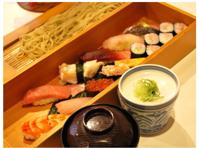
まる得握り 2,500 円 (税込 2,750 円) セット布のりそば+300 円(税込 330 円)