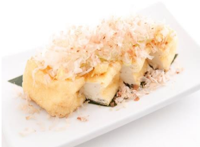
揚げたて厚揚げ 450 円(税込 495 円)